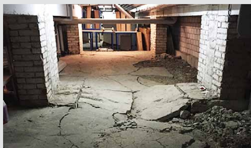
Kriechkeller mit defekter Bodenplatte