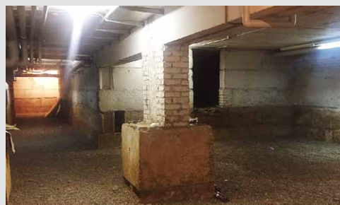
Keller nach den Aushubarbeiten