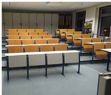
Raum 310 (Chemie) – vorher