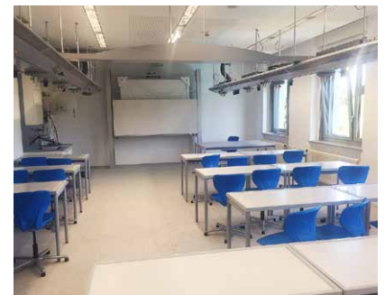
Raum 310 (Chemie) – nachher

Die Arbeiten sind noch nicht ganz abgeschlossen, aber seit Montag findet zumindest in 2 Fachräumen schon Unterricht statt. Man kann jedoch jetzt schon deutlich erkennen, wie hell und modern unsere neuen naturwissenschaftlichen Klassenräume am Ende sein werden. Nachstehend ein erster Vergleich: Vorher – Nachher! Professionelle Fotoaufnahmen sind für Ende nächster Woche geplant. Und auch für das Willkommensfest am 08.09. sind selbstverständlich Führungen für die Eltern geplant.