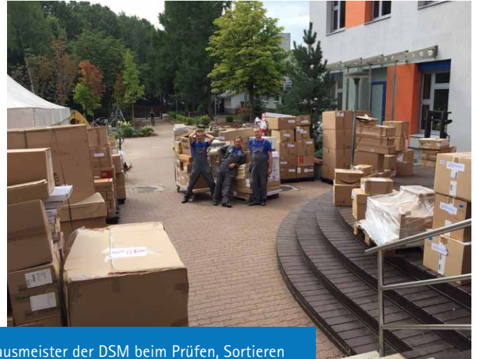
Die Hausmeister der DSM beim Prüfen, Sortieren und Verteilen von Material- und Möbellieferungen für den Kindergarten, die Grundschule (insb. Werken), IT und viele andere Abteilungen.