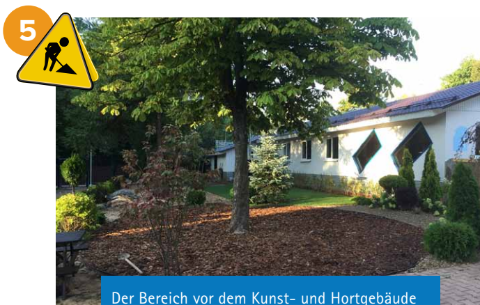
Der Bereich vor dem Kunst- und Hortgebäude wurde begrünt. Es wurde Platz für zusätzliche Spielgeräte geschaffen.

Unsere Schule steht in der Verantwortung, Schülerinnen und Schülern, deren Eltern sich zumeist aus beruflichen Gründen zeitweise in Moskau aufhalten, die erfolgreiche Fortsetzung ihrer Schullaufbahn zu ermöglichen und eine Wiedereingliederung bei Rückkehr nach Deutschland in die dortige Schullandschaft vorzubereiten. Dieser Aufgabe fühlen wir uns weiterhin verpflichtet und die Veränderungen sollen die Lern- und Arbeitsbedingungen verbessern.