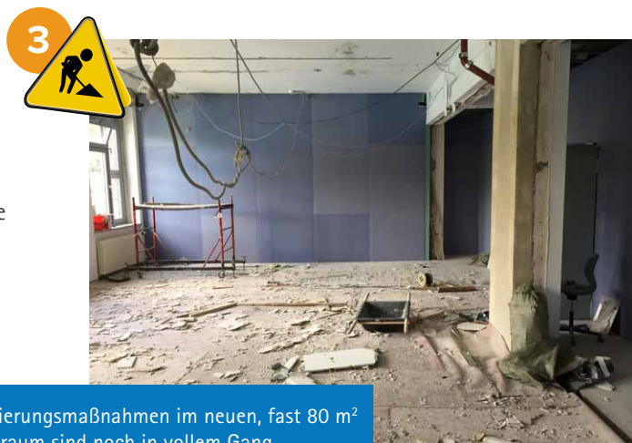
Die Schallisierungsmaßnahmen im neuen, fast 80 m 2 großen Musikraum sind noch in vollem Gang.

Die ehemaligen Umkleieräume der Sportlehrer im 2. OG werden zu Umkleiden für Jungen fertig umgebaut. Die bisherigen Umkleiden im 1. OG werden zukünftig von den Sportlehrern und als Lagerräume genutzt, womit die Geräte und Materialien aus der Sporthalle 2 entfernt werden konnten.