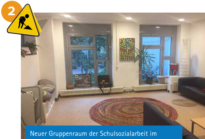
Neuer Gruppenraum der Schulsozialarbeit im ehemaligen Ressourcenzentrum der DSM.

Der Unterrichtsraum Kunst wurde innerhalb des gleichen Gebäudes verschoben und durch Farbe, Fenster und Beleuchtung sehr viel heller und freundlicher gestaltet.