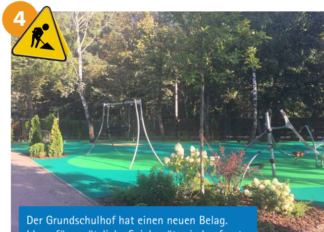
Der Grundschulhof hat einen neuen Belag. Ideen für zusätzliche Spielgeräte sind gefragt.