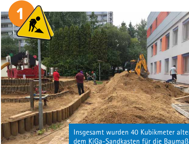
Insgesamt wurden 40 Kubikmeter alter Sand aus dem KiGa-Sandkasten für die Baumaßnahmen verwendet und frischer Sand eingebracht.