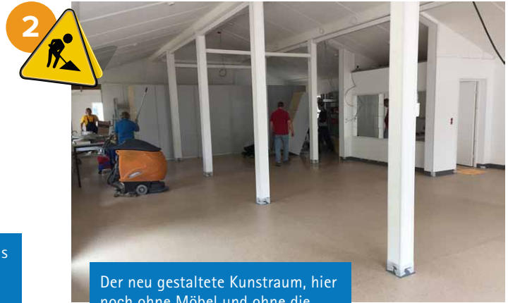
Der neu gestaltete Kunstraum, hier noch ohne Möbel und ohne die moderne neue Beleuchtung.

Für die Bereiche der Schulsozialarbeit , der Kunst und des Hortes wurden räumliche Veränderungen durch den Umzug der Schulsozialarbeit in das Hauptgebäude erreicht.